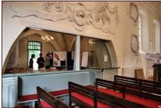
Vorbereitung der Arbeitsgruppen