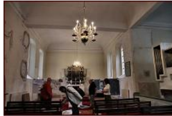
Blick in die Seegefelder Kirche