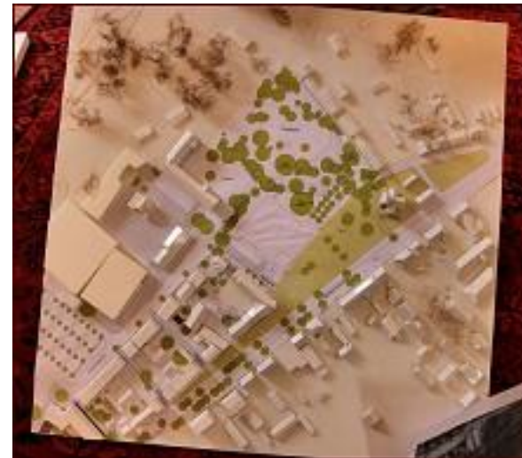
Entwicklung des Zentrums wie es die Stadt plant